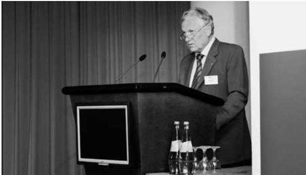
Präsident Hansjörg Staehle