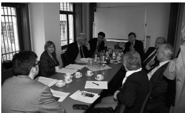
In der Bayerischen Vertretung