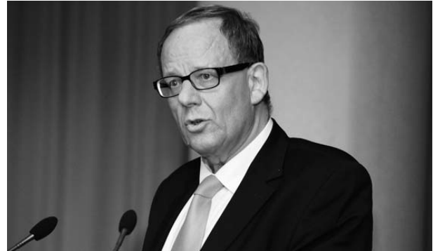
Präsident des Bayerischen Anwaltverbandes Anton Mertl

Die Versammlung erteilte dem Kammervorstand bei einer Gegenstimme die Entlastung.